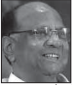
मा. ना. शरदचंद्रजी पवार